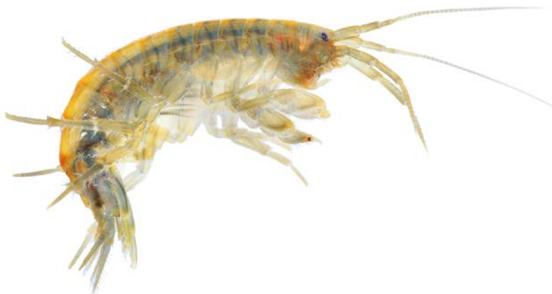
Figuur 2. De vlokreeft Gammarus, een voorbeeld van een organisme waarvan het gedrag wordt beïnvloed door antidepressiva.

Van hormonen is bekend dat ze in het milieu effect kunnen hebben op de voortplanting van vissen; pijnstillers kunnen weefschade bij vissen veroorzaken, antibiotica beïnvloeden algen en cyanobacteriën, en antidepressiva veroorzaken gedragsveranderingen bij verschillende soorten organismen. Er zijn vrijwel geen normen voor (dier)geneesmiddelen beschikbaar. Sommige antibiotica, antidepressiva en pijnstillers hebben in het laboratorium effecten op diverse waterorganismen (bijvoorbeeld algen, schelpdieren en watervlooien) bij concentraties die in het veld ook voorkomen. De lokale blootstelling kan dus leiden tot een slechte ecologische kwaliteit.