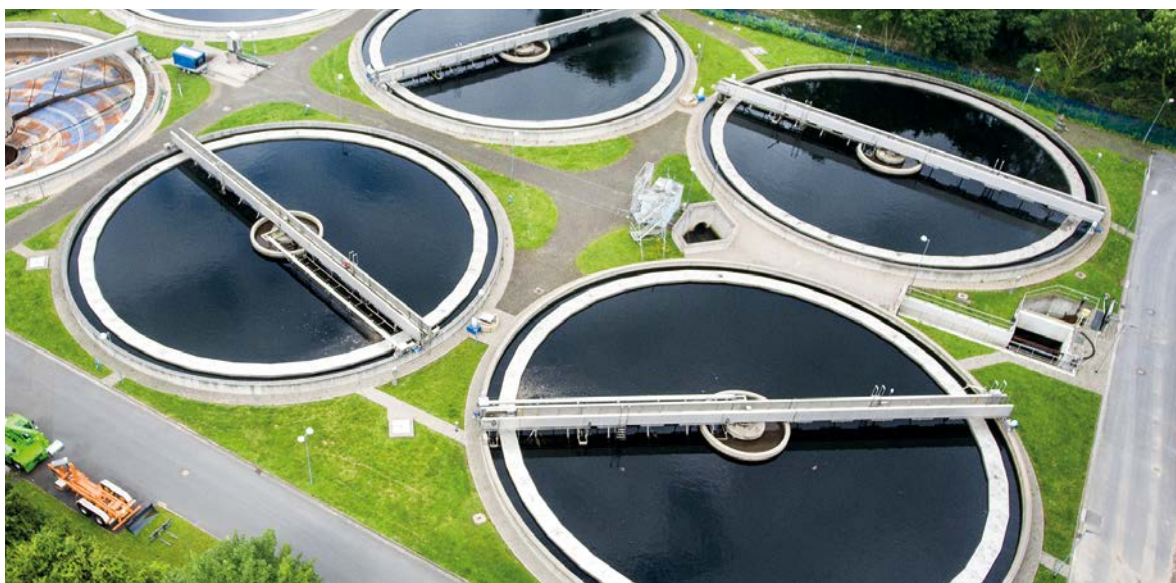
Figuur 4. Rioolwaterzuiveringsinstallatie.

Andere wetgeving (zoals de Kaderrichtlijn Water) wordt bij de registratie niet meegenomen. Uitwisselen van gegevens tussen de verschillende kaders biedt kansen doelmatig beleid te voeren. De farmaceutische industrie is recent met een voorstel gekomen om bij de milieubeoordeling rekening te houden met de waterkwaliteitsregelgeving en zo nodig gericht de milieukwaliteit te monitoren.