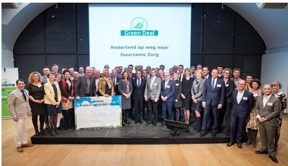
Start Green Deal Duurzame Zorg in 2015, initiatief Milieu Platform Zorgsector en min. van EZK

De afgelopen jaren staan nieuwsberichten vol met onderwerpen als: energietransitie, klimaatakkoord van Parijs, duurzame inzetbaarheid, circulaire economie, stikstofnormen, natuurrampen etc. Ieder jaar wordt dit thema zowel nationaal als mondiaal actueler. Vandaag de dag kan daarom geen enkele bestuurder er meer omheen: duurzaamheid moet op de agenda komen in alle lagen van de organisatie.